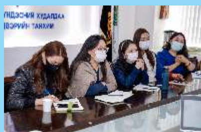
ХӨТӨЛБӨРТ ОРОЛЦОГЧИД МҮХАҮТ-ЫН ҮЙЛ АЖИЛЛАГААТАЙ ТАНИЛЦАВ

МҮХАҮТ-ын ПЛАТИНУМ гишүүн болсноор www.trademongolia.mn цахим хуудсанд байгууллагынхаа танилцуулга, үйлчилгээ, мэдээ мэдээллээ байршуулах, оны онцлох аж ахуйн нэгжийн аянд оролцох, гадаад худалдааны зөвлөгөө мэдээлэл авах, гадаад улсад зохиогдох бизнес форумд хамрагдах, дотоод, гадаадын үзэсгэлэн худалдаанд бараа бүтээгдэхүүнээрээ оролцох зэрэг олон давуу талуудтай билээ.