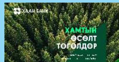
ХААН БАНК ШИНЭ АЛСЫН ХАРАА, ЭРХЭМ ЗОРИЛГОО ТАНИЛЦУУЛЛАА