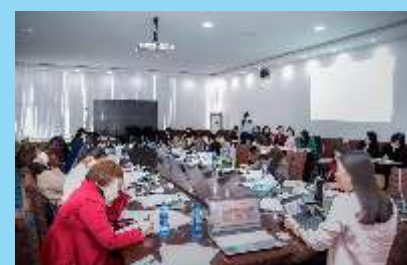
ХӨДӨЛМӨРИЙН ТУХАЙ ХУУЛИЙН ЦОГЦ СУРГАЛТЫГ ТОГТМОЛ ЗОХИОН БАЙГУУЛЖ БАЙНА